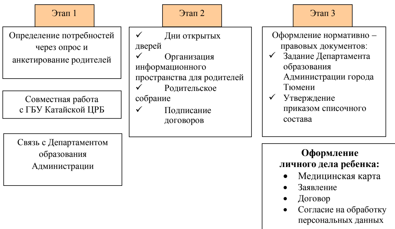
Рис. 3. «Этапы организации детей КМП»

С целью изучения степени удовлетворенности родителей качеством образовательных услуг консультационно – методического пункта, предоставляемых дошкольным образовательным учреждением, условиями пребывания их детей в детском саду, с целью выявления мнения родителей о получении образовательных услуг, а также возможные пожелания предусмотрено проведение социологического